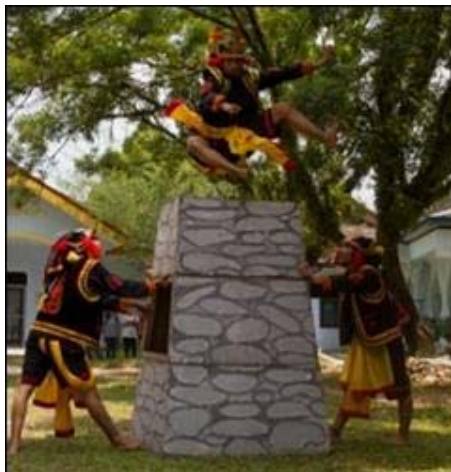
Gambar 1: Tari Nias di Departemen Etnomusikologi FIB USU Medan 2013

Pujakesuma (Putra Jawa Kelahiran Sumatera). Organisasi ini bahkan memiliki kekuatan politis dalam konteks Sumatera Utara, selain partai-partai politik yang memang telah ada di negara Republik Indonesia ini. Masyarakat Tionghoa juga tidak ketinggalan membentuk organisasi-organisasi kultural yang berbasis ekonomi berdasarkan asal-usul mereka dari negeri China. Misalnya adalah persatuan dagang orang-orang Tionghoa yang berasal dari Kanton. Demikian pula persatuan marga-marga Tiongho yang ada di Sumatera Utara. Masyarakat Sunda pun memiliki organisasi kebudayaan Sunda yang mereka sebut dengan PWS (Paguyuban Wargi Sunda). Organisasi orang-orang Sunda di Sumatera Utara ini mejadi wadah untuk saling bersilaturrehmi dan melestarikan kebudayaan Sunda yang ada di Sumatera Utara. Demikian juga untuk etnik-etnik yang lainnya yang ada di Sumatera Utara ini.