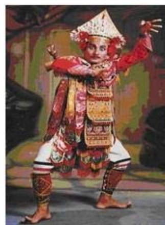
Gambar 4: Tari Baris Bali Oleh Sinar Budaya Grup 2002

Tabel 1: Keberadaan Seni Tradisi dalam Kebudayaan Etnik di Sumatera Utara