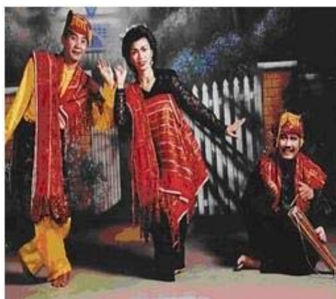
Gambar 3: Tari Tiga Serangkai Karo Oleh Sinar Budaya Grup 2001