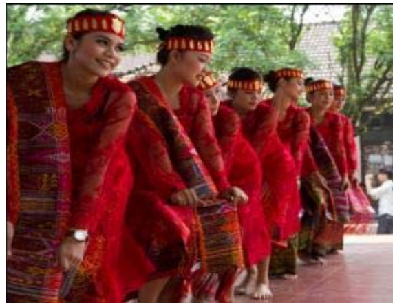
Gambar 2: Tortor Naposo oleh Para Mahasiswa Etnomusikologi FIB USU 2013